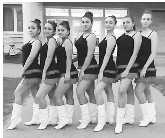
Csinosak, szépek, tehetségesek, szorgalmasak...

– Az egymás iránti tisztelet és megbecsülés segít bennünket a sikerhez, és így tudunk túllépni a negatív tényezőkön is. Hiszen a bizonyítás megerősíti a csapatot. Nagyon sok szép élményem van, és még szeretném sok tanítványomat hasonlóan szép eredményekhez segíteni.