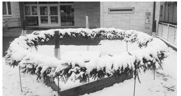
Hó lepte be a művelődési ház előtt felállított adventi koszorút, melyen sorra gyűjtötték advent fényeit...

Minden kedves olvasónknak boldog karácsonyt, és örömeiben gazdag új esztendőt kívánunk! A szerkesztőség